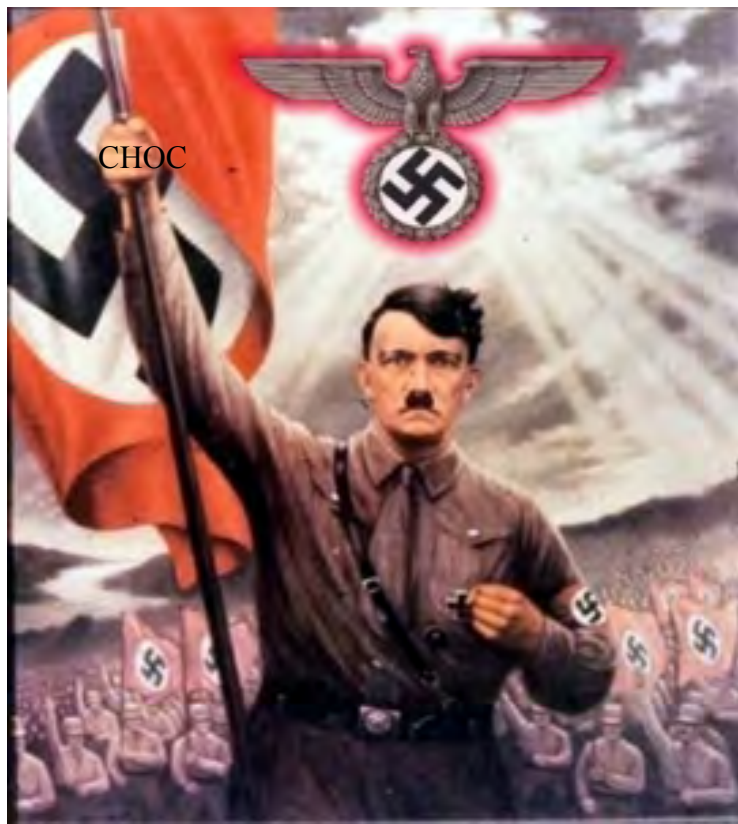
L'alliance USA - Reich : compromise ?

IIIe Reich • La face cachée de l'Empire enfin dévoilée ! A quelques jours de la rencontre historique entre Kennedy et Hitler, des documents inédits et terrifiants ont été mis au grand jour. Reportage de notre envoyé spécial à Berlin, Charlotte Maguire. >2